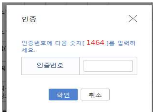
[인증번호 팝업 예시][인증번호는 매번 변경됨]